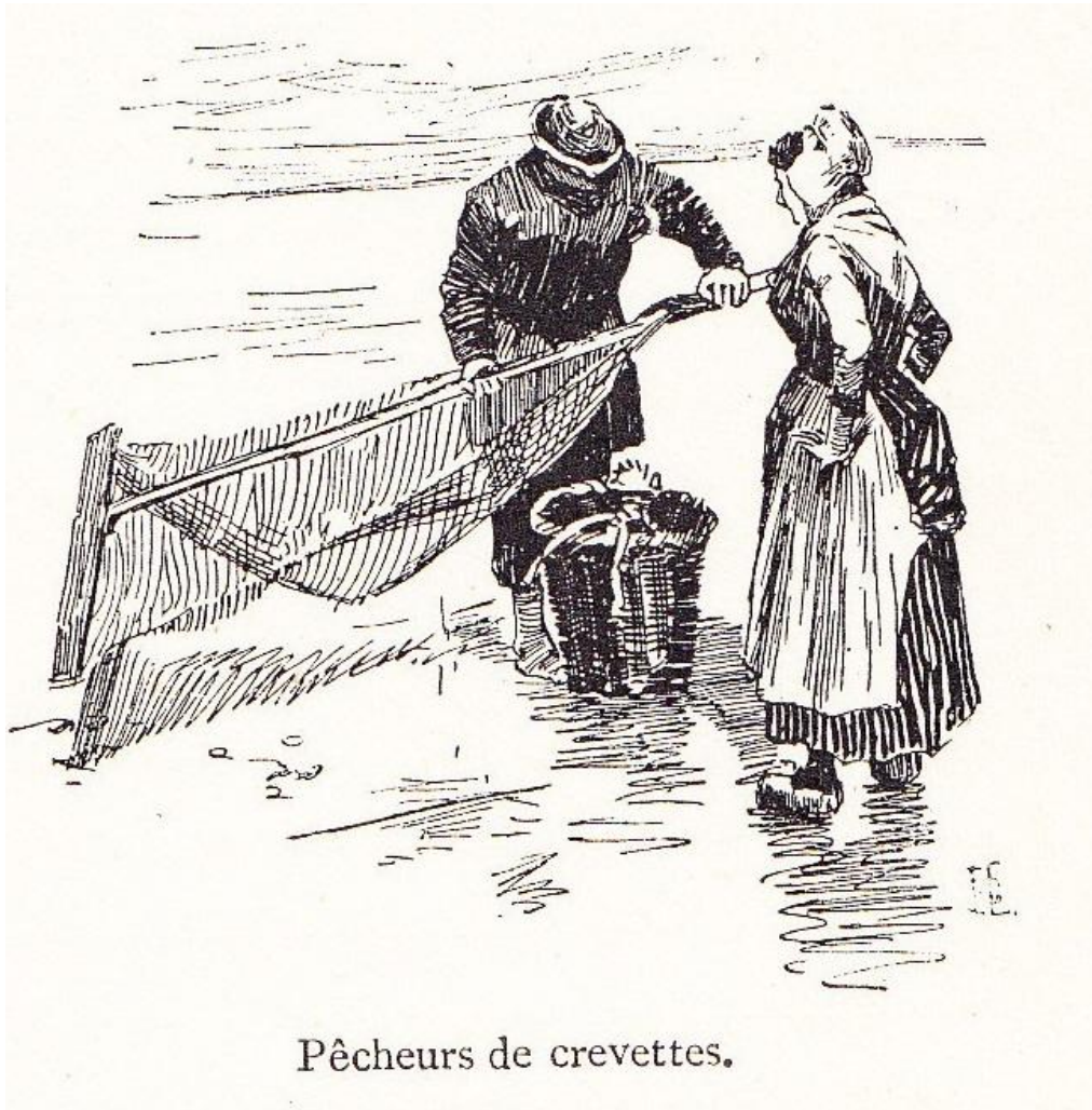
Pêcheurs de crevettes.